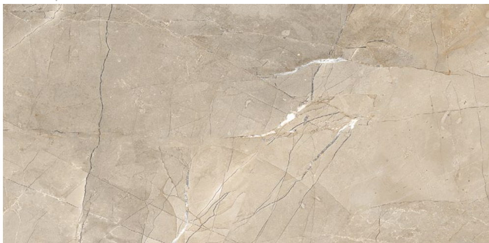
PUL120GRE PULPIS GREIGE LEVIGATO RETT. 60X120 - F0161