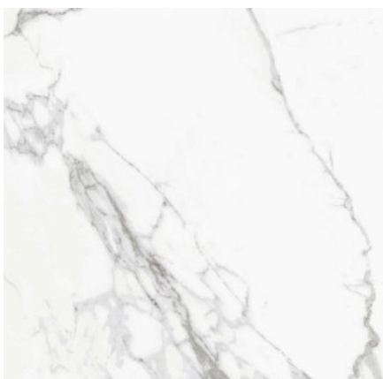
MRL60ST MARBLE STATUARIO LEVIGATO RETT. 60X60 - F0166