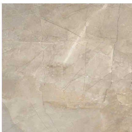
PUL60GRE PULPIS GREIGE LEVIGATO RETT. 60X60 - F0166