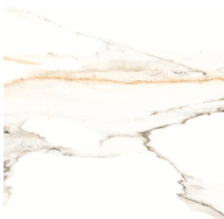
GLD60CA GOLD CALACATTA LEVIGATO 60X60 - FO 166