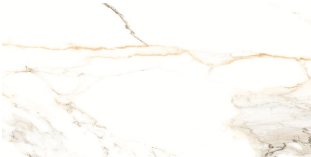
GLD120CA GOLD CALACATTA LEVIGATO 60X120 - FO 161