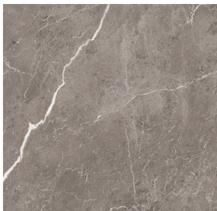
STN60LG STONE LUX GREY LEVIGATO RETT. 60X60 - F0160