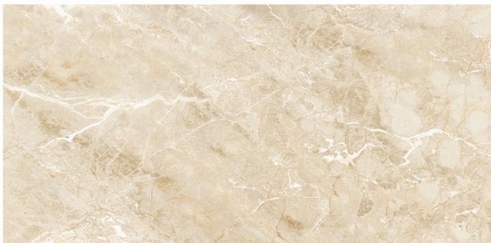
BRE120GR BRECCIA GREIGE LEVIGATO RETT. 60X120 - F0162