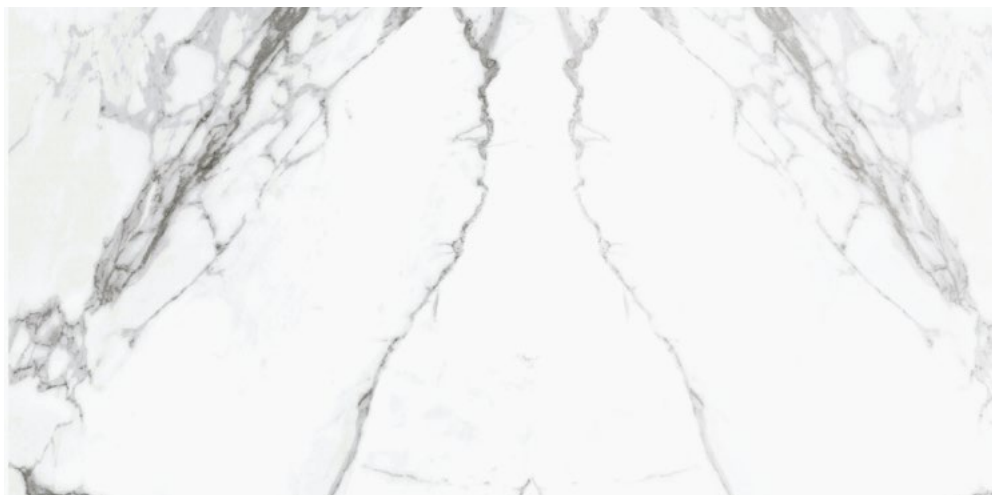
MRL120ST MARBLE STATUARIO LEVIGATO RETT. 60X120 - F0161