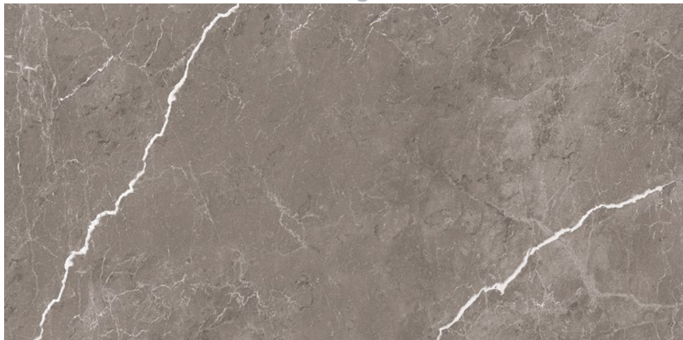
STN120LG STONE LUX GREY LEVIGATO RETT. 60X120 - F0162